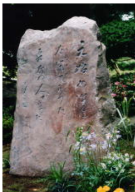
神奈川県茅ヶ崎市 「らいてうの記念碑」 (1998年建立)