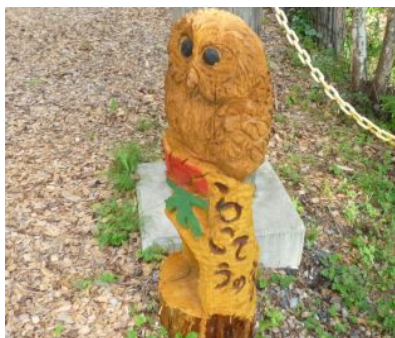
「家」の番人にふくろう君が仲間入り