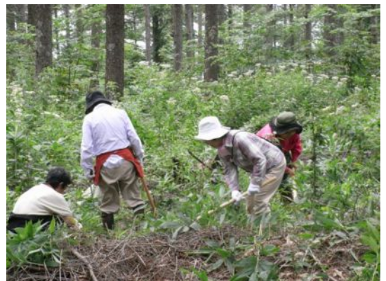
背丈より高いヨツバヒヨドリ草たち

アサギマダラという美しい蝶がゆったりと飛び、カワミドリというあまり目にする事のない野草が、薄紫の花をつけていたり、ベニバナイチヤクソウの花がらも残っていたりと楽しい発見をしながら約20人で作業を終えました。アサギマダラの食草のヨツバヒヨドリ草は、ちゃんと刈り残しました。甘い香りの花にアサギマダラがやってくるのです。昨年、9月下旬にらいてうの家を訪ねた佐久の方が、らいてうの森で、アサギマダラ蝶が乱舞する夢のような光景に遭遇したそうです。