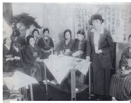
新婦人協会第 1 回総会 1921/6/12

戦後 70 数年、今、政治の状況は？ 私たちはその獲得した政治的権利を生かしているでしょうか。新婦人協会の活動から、改めて考えて見たいと思います。